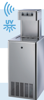
Niagara Floor Standing