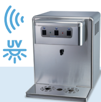
Niagara Table Top