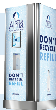
Acqua Alma Point